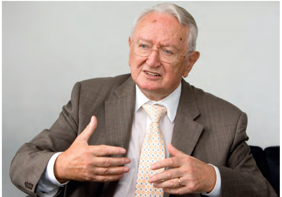
Dr. h.c. Helmut O. Maucher, heutiger Ehrenpräsident und langjähriger Chef des Nestlé-Konzerns, ist Mitglied des Kuratoriums der Universität Bayern. Wirtschaftlicher Erfolg, so seine Unternehmensphilosophie, ist nur von Dauer, wenn Werte wie soziale Verantwortung, Ehrlichkeit und Fairness in der Unternehmensführung vorgelebt werden.

Das warum ist ganz einfach. Noch immer wendet Deutschland im Gegensatz zu anderen Industrienationen weniger Geld für die Hochschulbildung auf. Wofür brauchen wir es? Zum einen für den anrollenden Studentenberg, der aus der Kinderwelle der geburtenstarken Jahrgänge resultiert. Er wird die Hochschulen 2010 spätestens erreichen und eine Verdoppelung der aktuellen Studentenzahlen bringen. Wenn wir jetzt nichts unternehmen, bricht spätestens dann das System zusammen! Das muss die Politik jetzt zur Kenntnis nehmen! Die Politik kann nicht in jeder Sonntagsrede die Bedeutung der Bildung für unseren Standort unterstreichen und gleichzeitig die Universitäten nicht mit Mitteln